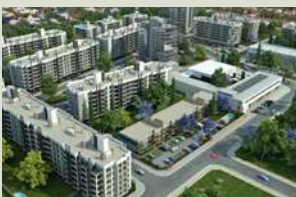
DISTRITO BOERO M2 de construcción: 9.300 m 2