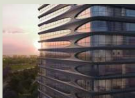
L'AVENUE LIBERTADOR M2 de construcción: 42.110 m 2