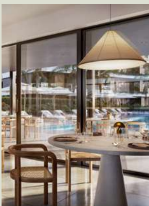
Restó privado & Wine bar