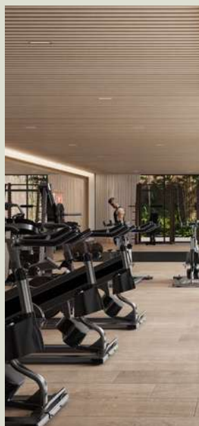
Gimnasio & espacio wellness