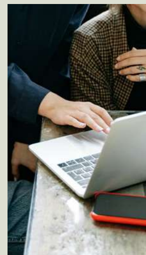
Cowork & Oficinas