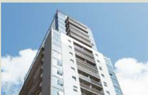
MY SOHO M2 de construcción: 20.143 m 2

Grupo Portland tiene más de 20 años de experiencia en el mercado de Bienes Raíces. Actualmente está desarrollando + 160.000 m 2 y tiene dentro de su portfolio el único edificio de Zaha Hadid en Latinoamérica.