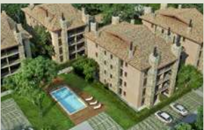
GREEN STYLE M2 de construcción: 5.300 m 2