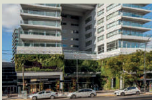
PALMERA OLIVOS M2 de construcción: 31.800 m 2