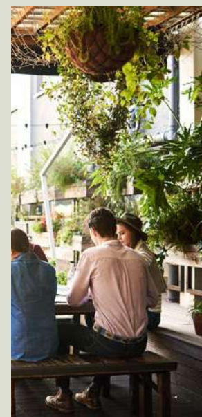
SUM con parrillas