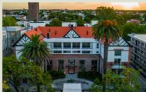
CASSA ISIDRO M2 de construcción: 18.556 m 2