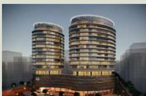
INFINITY TOWERS M2 de construcción: 44.772 m 2